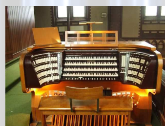
Hollenbach 1893, Jörgensen 1943, Schuke 2010 (neuer Prospekt)